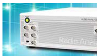
オーディオアナライザ

目黒電波測器製品は、ラジオやAM/FMアンプの試験・検査などにご活用いただける信号発生器や電話・インターフォンなどの音声設備向け試験器、各種衛星システムや交通通信システム向けデバイスの評価/検査機器を中心としたラインナップで展開しております。今後とも宜しくお願ひ申し上げます。