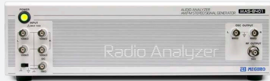
Audio Analyzer Signal Generator

MAS-8400シリーズは、オーディオアナライザとAM/FM信号発生器の機能を組み合わせ、用途に合わせて3つの機種からお選び頂けます。 自動計測を行う生産現場向けに高速測定かつ、省スペース・省エネ・低コストを追求した製品です。