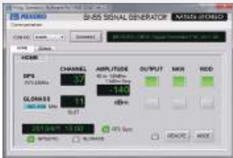
↑標準 メイン操作画面