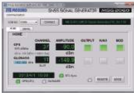
↑オプション メイン操作画面